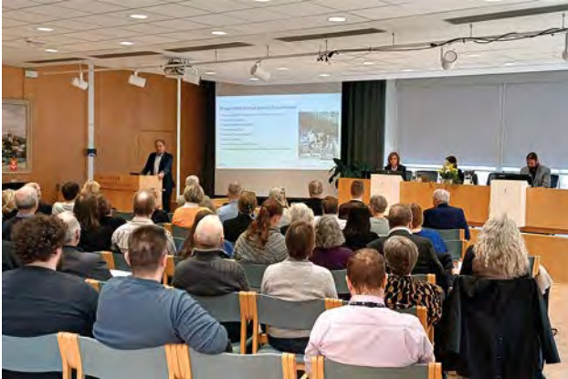
Sydkustens årsmöte i Pargas 24.4.2025.