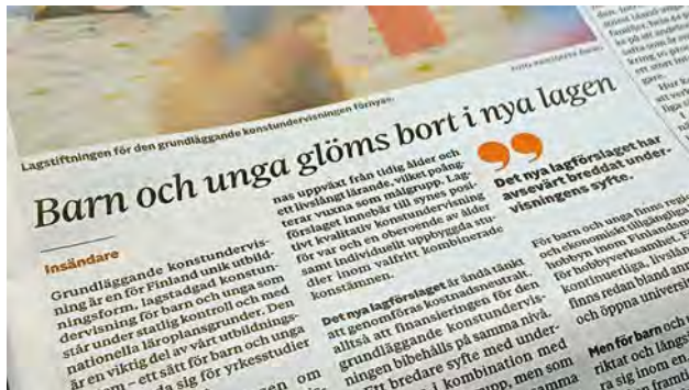
Insändare i Hufvudstadsbladet hösten 2025.

Kulturum har under året arrangerat 19 nätverksträffar och evenemang som samlat över 350 professionella inom konst- och kulturföstran från olika delar av Finland. Under året har det ordnats träffar på plats i Malax och Karis för att samla regionala aktörer inom konstundervisning och barnkultur och två nätverksträffar för externa utvärderare inom Skapa-projekten. Den 23–24 oktober arrangerades Konstundervisningsdagarna som lockade över 120 konfe-