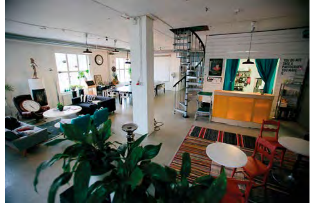
Försonmarträff på Malakta i Malax.

rensdeltagare till Esbo, en storsatsning för projektet tillsammans med Sydusten och flera samarbetspartner.