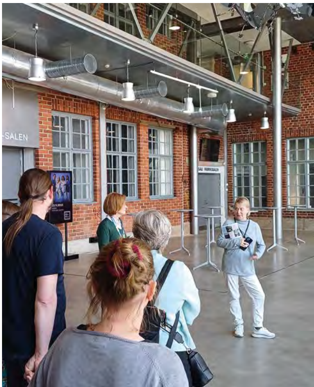
Personaldag på Konstfabriken i Borgå.