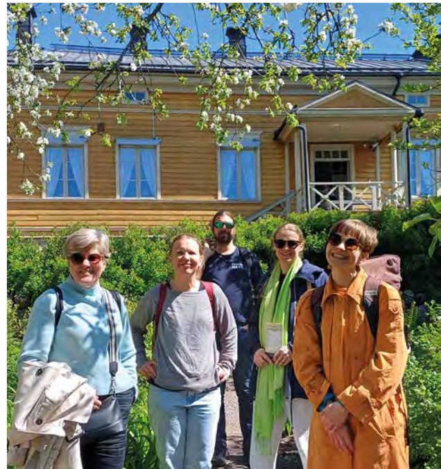
Personalen på rekreationsdag i Borgå i maj 2025.

Syd kustens landskapsförbund anslöt sig till Bildningsbranschen rf (Sivista) och utvecklade en personalhandbok för kollektiva villkor. Syd kust har erbjudit personalen motions- och kultursedlar, subventionerad lunchförmån och utbildningsmöjligheter samt arrangerat gemensamma planerings- och rekreationsdagar.