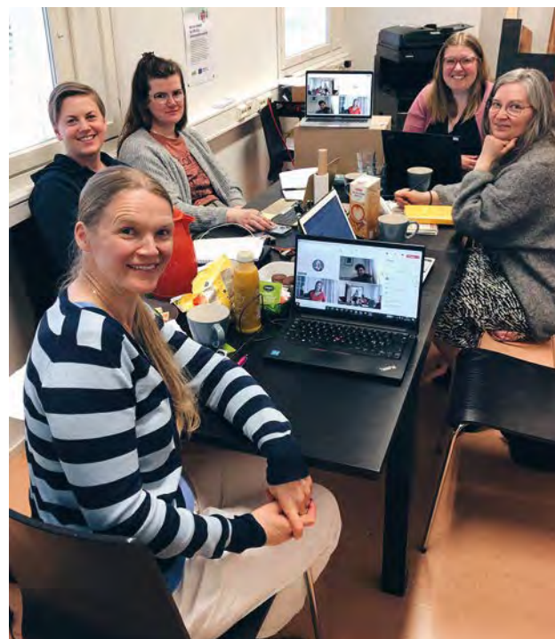
Kulturskolorna i Åboland möttes kring Kulturklöver-modellen.

ber. Sydkusten fungerar fortsättningsvis som koordinator för Kulturskolor i Åboland, ett åboländskt samarbete kring grundläggande konstundervisning. I februari deltog kulturskolorna i den nationella kampanjen Kreativitet i politiken .