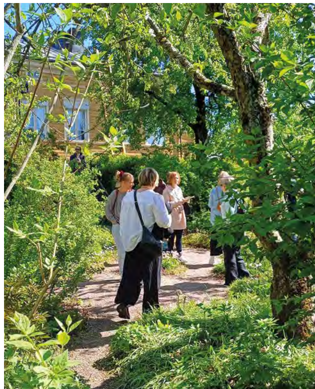
Besök på Runebegrs hem i Borgå under personaldagen.