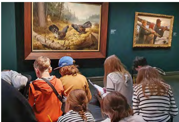
Sommarkurs på Ateneum i Helsingfors.

Under tre år har Åbo Akademi projekt Skapa Ordkonst arbetat för att öka tillgången till ordkonstverksamhet för barn och unga i Svenskfinland och se till att den vilar på vetenskaplig grund. Ordkonstskolan har medverkat på kurser och fortbildningar och samarbetat aktivt för att stöda nya aktörer att starta ordkonstverksamhet. År 2025 har också präglats av den pågående lagreformen inom grundläggande kostundervisning. Ordkonstskolan har aktivt tagit del av utvecklingsarbetet och har en representant i arbetsgruppen för gymnasiediplom i ordkonst.